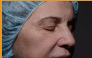
Después de 3 tratamientos