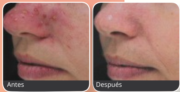
Cortesía de Aditya Gupta, MD